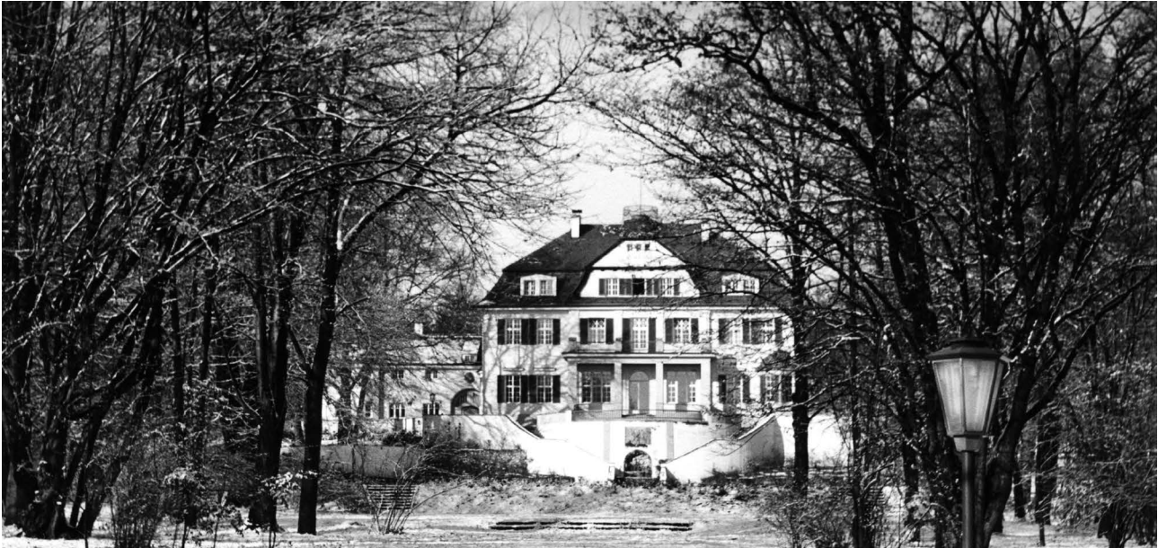
Haus-Eggenberg der SWP, Nerlichs Arbeitszimmer lag im ersten Stock, die beiden Fenster zur Linken

Nerlich der DGAP noch Jahre verbunden. Er blieb bei der SWP im „Haus Eggenberg“ bis zu seiner Pensionierung im Jahr 1995, unterbrochen allerdings durch Forschungsaufenthalte im Ausland, wobei der an der Stanford University (1973/74) der für ihn bedeutendste war. Angesichts der Vergrößerung und Differenzierung des Forschungsinstituts der SWP war die Funktion der „Forschungsleitung“ immer weniger auszufüllen. Aber als Mitglied der Institutsleitung hat er mit großem Erfolg bedeutende Impulse für die Arbeit der SWP gegeben und Schwerpunkte setzen können.